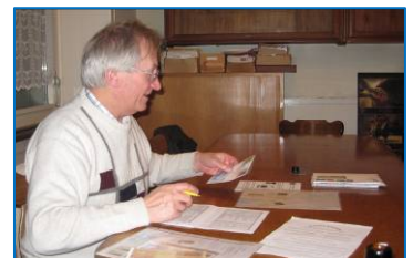
Nach der Auktion funkeln die Augen!