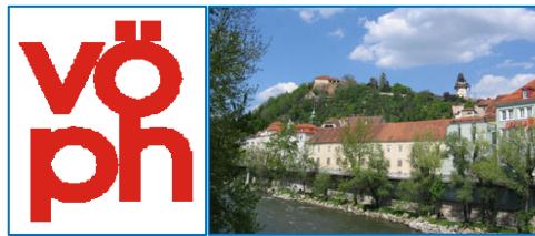
13.-15. Mai 2011 Graz