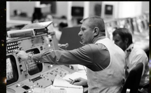
Gene Kranz, Flugdirektor, Mission Control Houston