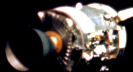
Apollo 13 SM – nach der Explosion